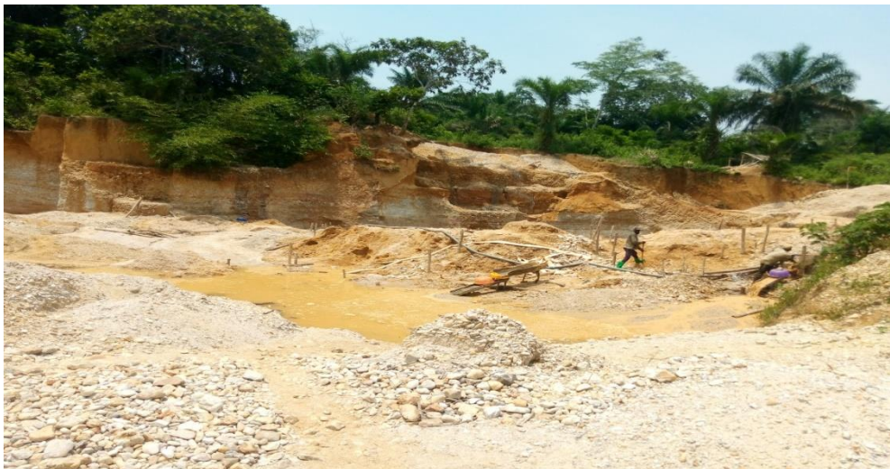
Photo : Site minier Tubungo dans la chefferie Wamuzimu

Ce site minier artisanal crée en 1981, est situé dans le groupement Bashikumbilwa, dans le village Lumembe. L'effectif des creuseurs dans ce site minier est de \pm 200 parmi lesquels 6 seulement possèdent des cartes valides. On y exploite de l'Or ainsi que le Coltan, la production mensuelle est estimée 60gr pour de l'Or et \pm 200 Kg pour le Coltan. Ce site étant non accompagné par une quelconque Coopérative, le creuseurs sont encadrés par un comité des creuseurs.