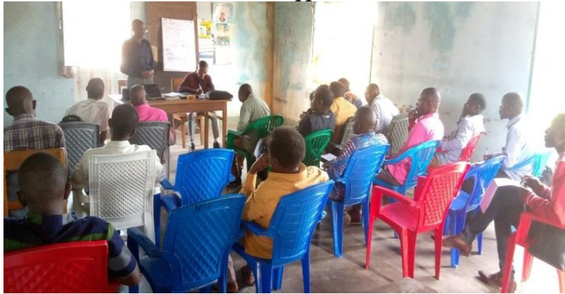
Les participants au dialogue sur les ressources naturelles à Baraka-Fizi

8. 46 sites miniers identifiés et 11 coopératives minières ont été identifiés secteur de Ngandja dont : ETUMBA, ASHISONDJWA, MKELA, MBULUMBULU, AKUME, ASAKWA, NAMBAMATANGI, MAUMBA, LWEMBA, NAHAMBWA, ETUMA, BIKYAKA, IBWA, LUTENDA, ELOMBWE, ABEKE, BICHUBU, ALENGE, MOKA, NAMLASI, NGEKI, SEMBE, ALONGWE dans le groupement de Basikalangwa . dans le groupement de Basimukuma Sud, Secteur de Ngandja :MKELA, LUKECI, SENGE, NAMLOMBWA, LWIKO, MLEKYA, ECUA, NAMTIMBWA, MAYIYAMOTO, MAYU,NGYOBWE, ANGE, BYALELE, ANGUTE, ASENGE, BAHATIYAIMBWA, IBWEMSOSHI, IBWA, ELOMBWE, NAMBYELE, EYANDABUTUNGU, AMUMBANANGYOMBE, AFE.