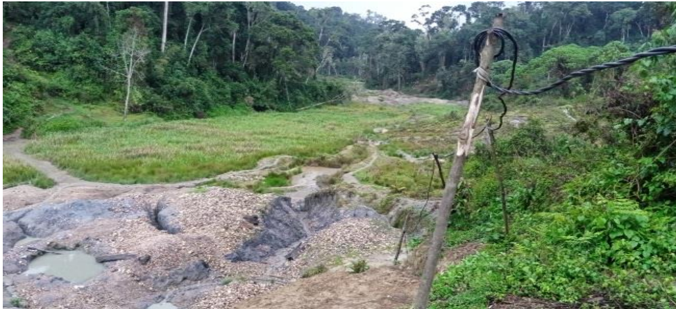
Photo : Site minier Chigubi