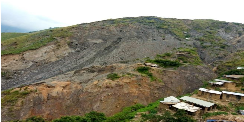
Photo : site minier Tchondo

Ce site minier se situe dans la localité de Nkambwe, dans le groupement Nirhinya en chefferie de Burhinyi. Lors de l'échange avec les exploitants miniers artisanaux qui exploitent ce site, ils ont expliqué que celui-ci a été créé en juin 1991. S'agissant de son effectif, les responsables de ce site ont montré que 250 creuseurs artisanaux exploitent ce site parmi lesquels 5 seulement possèdent des cartes des creuseurs valides, étant tous regroupés dans la Coopérative Minière Artisanale de Burhinyi qui travaille encore de manière informelle. Le type de minerais exploité à ce site minier c'est seulement de l'Or.