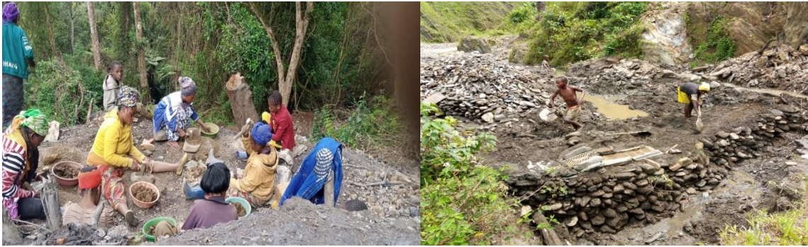
Les femmes et les enfants dans les sites miniers

Photos : Les femmes et les enfants dans les carrés de Tchondo et Cigubi en chefferie de Burhinyi en Territoire de Mwenga