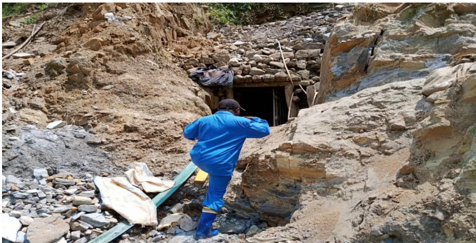
Photo : Un tunnel dans le site minier artisanal Kibanda dans la chefferie de Lwindi

Dans la chefferie de Lwindi, 10 sites miniers artisanaux ont été cartographiés, à savoir : Kahene, Kibanda, Zokwe rivière, Kyabilombo, Magungu, Kalesha, Lumetekelo, Ilongo, Misela et Kasaka.