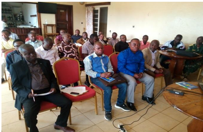
Représentant des chefferies à gauche

Cette activité a été réalisée dans les territoires de Mwenga dans 4 chefferies dont Lwindi, Basile, Wamuzimu et Burhinyi ainsi que dans le territoire de Fizi dans le groupement de Basikalangwa et Basimukuma Sud, Secteur de Mutambala.